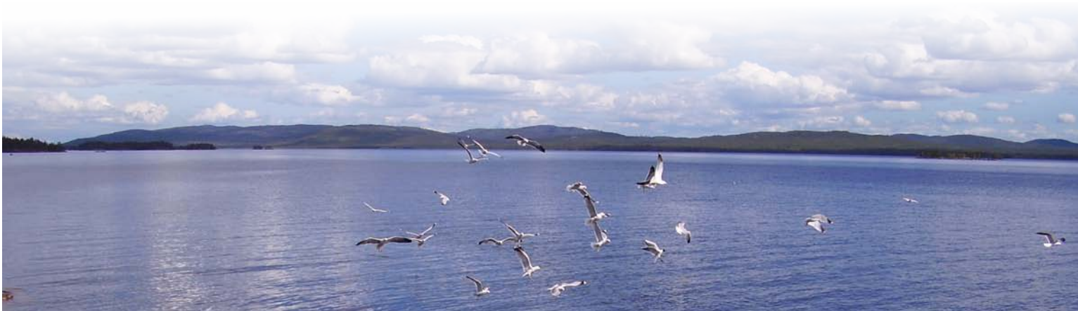
Lugar: Bosque Modelo Kovdozersky, Rusia

Asociado: cualquier miembro del público (incluidos individuos, corporaciones, organizaciones, gobiernos, agencias y asociaciones) que esté preparado para respaldar los objetivos del Bosque Modelo. Los asociados incluyen partes interesadas a nivel local, organizaciones donantes, la Secretaría de RIBM, oficinas regionales de la red de Bosques Modelo y otros.