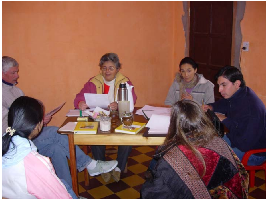
Lugar: Bosque Modelo Jujuy, Argentina

Además, el aprovechamiento de los recursos entre las partes interesadas en un panorama determinado aborda un problema recurrente y difícil: la sustentabilidad de la iniciativa misma. La pregunta sobre qué sucede cuando se agota la asistencia oficial de desarrollo es siempre una inquietud clave de sustentabilidad. Y cuando las agencias donantes evalúan las propuestas y las posibles organizaciones receptoras, frecuentemente examinan la posible sustentabilidad financiera a largo plazo del receptor.